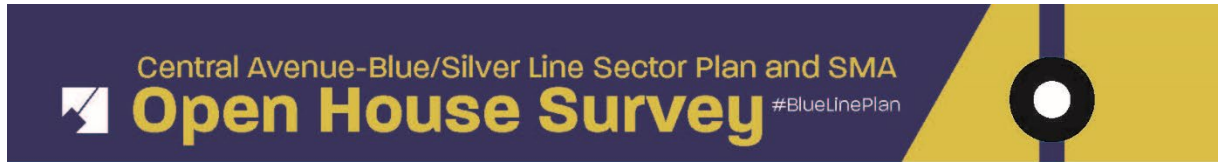
Figura 1. Versión impresa de la encuesta