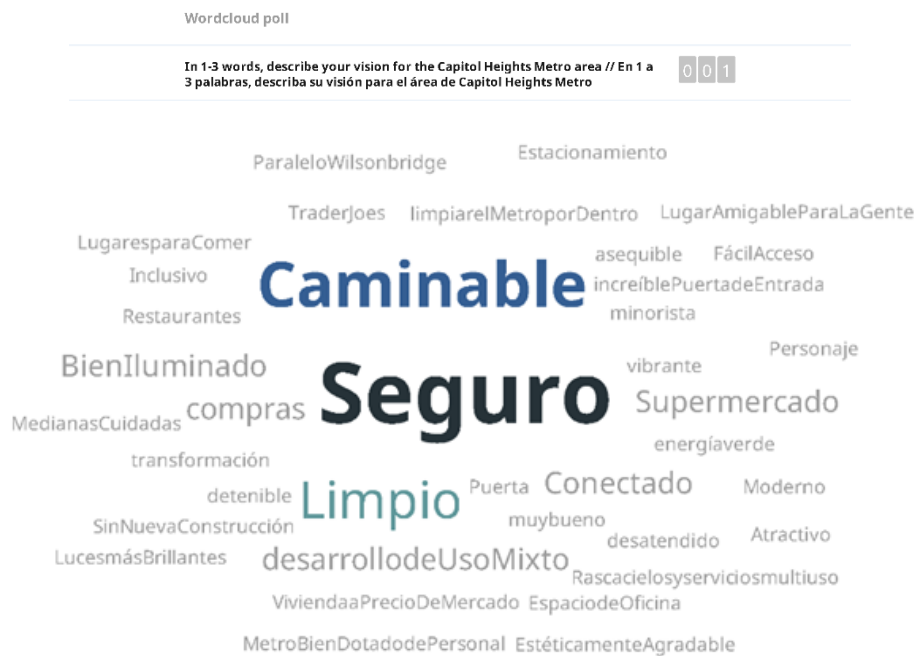
Figura 1 Nube de palabras sin procesar para la pregunta 2 de la encuesta de Slido