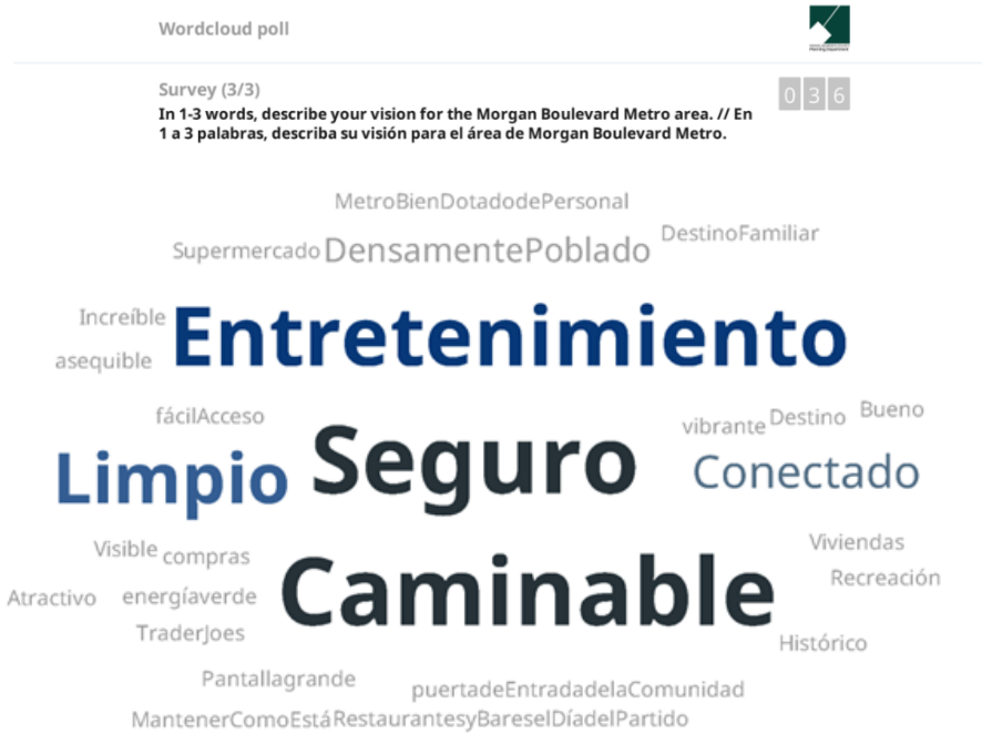
Figura 3 Nube de palabras sin procesar para la pregunta 3 de la encuesta de Slido