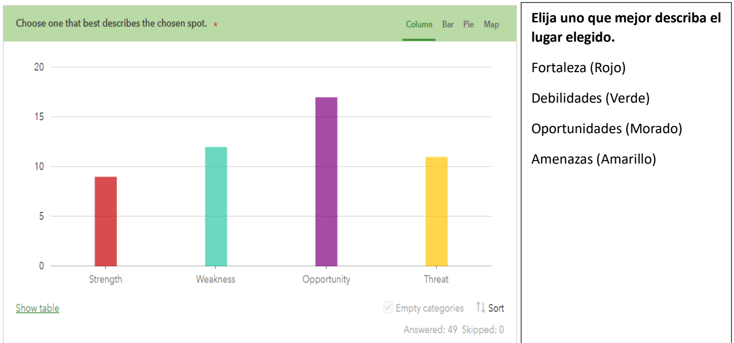
Figure 3. Respuestas del FODA

Los usuarios identificaron más lugares de oportunidad que cualquier otro artículo, lo que indica que el área tiene una variedad de lugares para realizar cambios e implementar la visión para el futuro (Figura 3). La mayoría de los usuarios aplicaron puntos dentro o adyacentes al límite del plan del sector, sin embargo, se seleccionó un punto más al oeste, fuera de la autopista, a lo largo de MD 214 (Avenida Central) más cerca de la intersección con la Ruta U.S. 301 (como se muestra en el mapa insertado en la Figura 4).