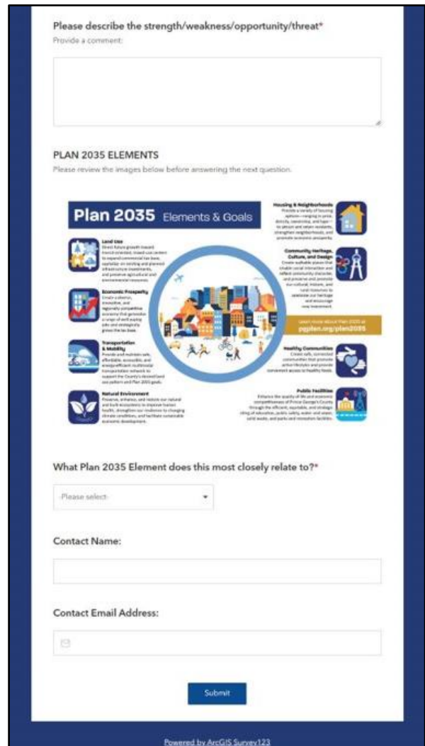
Figura 1. Survey123 Encuesta sobre el ejercicio de mapeo de aportes de la comunidad